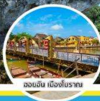
ฮอยอัน เมืองโบราณ