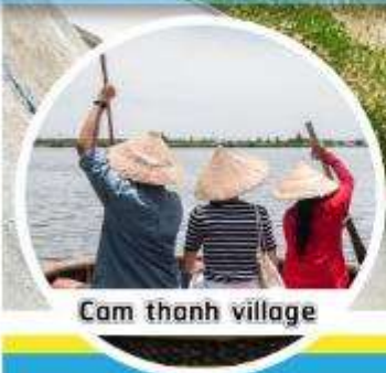
Cam thanh village

1-3 / 3-5 / 5-7 / 7-9 พ.ค.62 9-11 / 11-13 / 13-15 พ.ค.62 15-17 / 19-21 / 21-23 พ.ค.62 23-25 / 25-27 / 27-29 พ.ค.62 29-31 / 31 พ.ค.-2 มิ.ย.62