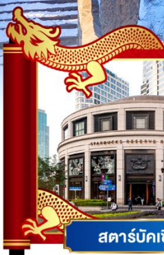
สตาร์บัคเซี่ยงไฮ้