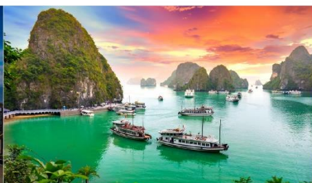
ล่องเรือชมอ่าวฮาลอง