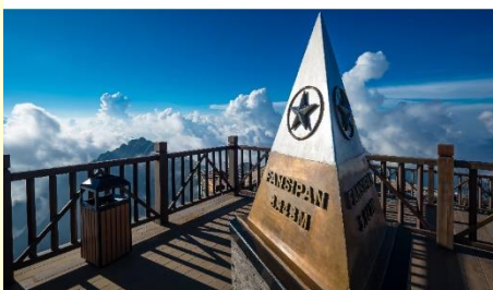
ยอดเขาฟานซิปัน