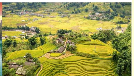
หมู่บ้านต้าฟาน

*กรณีห้องพักรับจองล่าช้า ขอสงวนสิทธิ์ในการเปลี่ยนวันเข้าพัก และปรับเปลี่ยนโปรแกรมโดยคำนึงถึงผลประโยชน์ลูกค้าเป็นสำคัญ