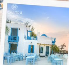
ซานตริ่น่าคาเฟ่

บุฟเฟ่ต์นานาชาติ บนบ้าน่าฮิลล์ และ บุฟเฟ่ต์ชาบู-บึงย่าง