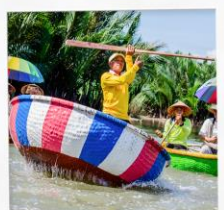
ล่องเรือกระดัง