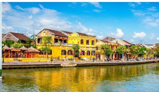
หมู่บ้านฮอยอัน