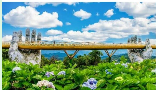
สะพานมือบานาฮิลล์