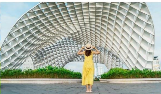
สวนเอเปค