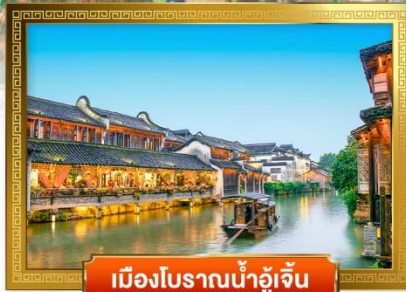
เมืองโบราณน้ำอุ๋จิ้น