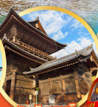
วัดนินเซนจิ