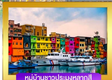
หมู่บ้านชาวประมงหลากสี