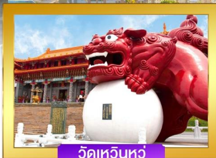
วัดเหวินหัว