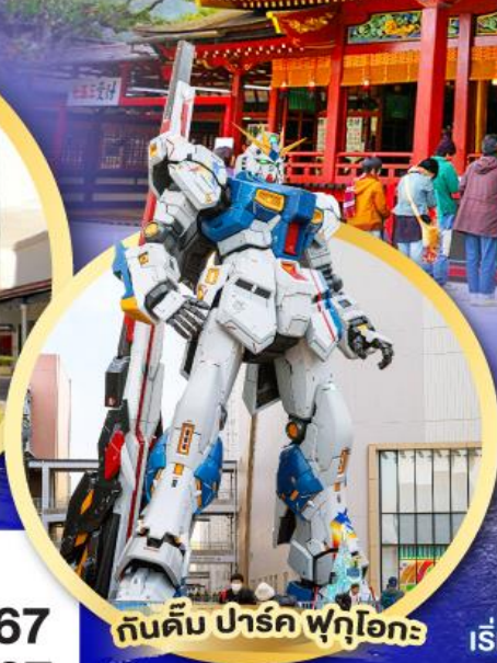
กันดั้ม ปาร์ค ฟุคุโอกะ