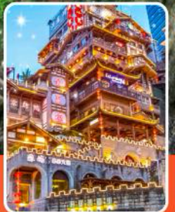
หงหยาดัง

เที่ยวฟิน 3 มรดกโลก เช็คอินครบทุกจุดไฮไลท์ !!