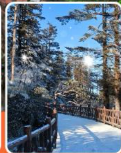
ภูเขาหว่าอูซาน