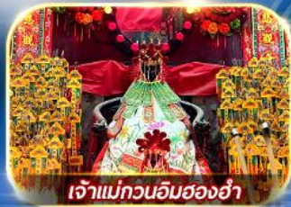
เจ้าแม่กวนอิมสองฮา