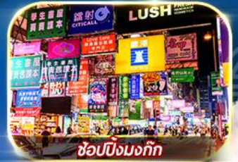
ซ้อปิ้งมก๊ก

เต็มอิ่ม ทั้งไหว้พระขอพร การเงิน การงานความรักและซ้อปิ้ง