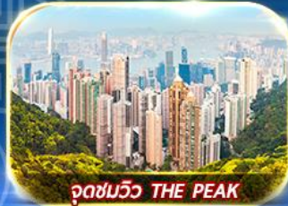
จุดชมวิว THE PEAK