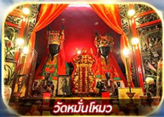
วัดหมื่นโหมว