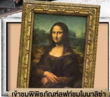
เข้าชมพิพิธภัณฑ์ลูฟวร์ชมโมนาลิซ่า