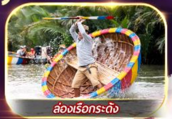
ล่องเรือกระด้ง

สัมผัสความงามหมู่บ้านฝรั่งเศสที่ บานาฮิลล์ 1 คืน เยือนเมืองโบราณฮอยอัน ล่องเรือกระด้ง