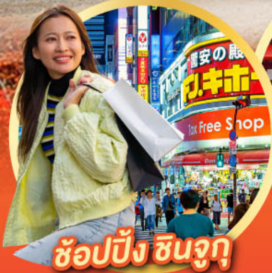
ช้อปปิ้ง ซินจูกุ

นั่งกระเช้าชมวิว ใบไม้เปลี่ยนสี Mt.Adatara