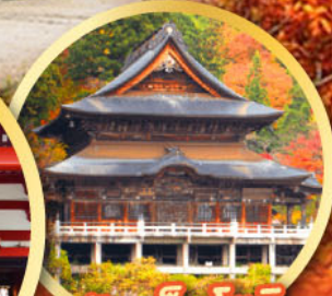
วัดเอ็นโซจิ

กิจกรรมเก็บผลไม้ พักออนเซ็น 2 คืน พักโรงแรมในโตเกียว 2 คืน