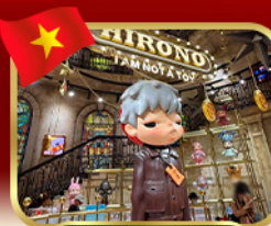
popmart บานาฮิลล์