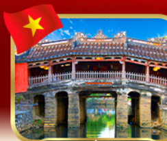
สะพานญี่ปุ่นโบราณ