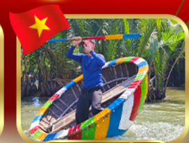
ล่องเรือระดั่งกัมทวน