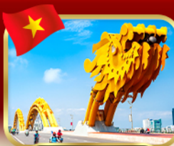
สะพานมังกร ดานัง