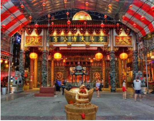
แล้วชวนไว้ที่ลาน

วัด คนที่นี้เชื่อว่าคำอธิษฐานจะส่งไปถึงเทพเจ้าบนสวรรค์เพราะรูปยาวจะอยู่ได้นานกว่ารูปธรรมดา