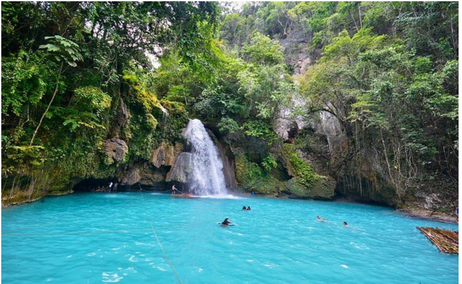
GO1CEB-5J102 CEBU Mabuhay Sea. Sand. Smile. ดำน้ำชมฉลามวาฬ เกาะโปโฮล 4วัน2คืน โดยสายการบิน Cebu Pacific (5J)