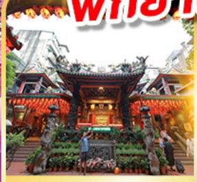
วัดเทียนโฮ่ว