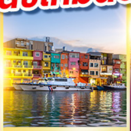
หมู่บ้านประมงเจิ้นปิง