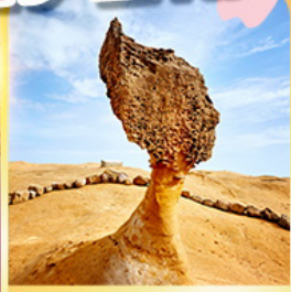
อุทยานเหยี่ยวหลิว