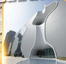
โรงละครไทจง