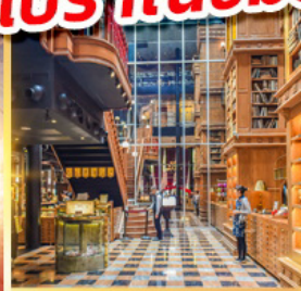
ร้านไอศกรีมมียาฮารา