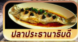
ปลาประจักษ์ริบตี