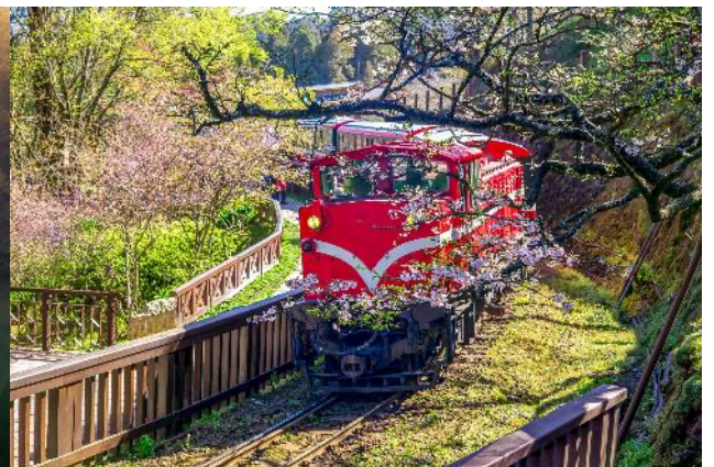
เดินชมสวนสนพันปี