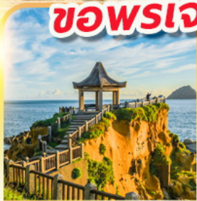
เกาะเหอฝิง

พักย่านซีเหมินติง 2 คืน ขอพรเจ้าแม่กวนอิมพันมือ