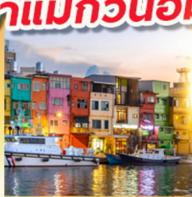
ท่าเรือประมงเจิ้งปิน