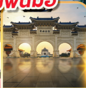
อนุสรณ์เจียงโคเชก