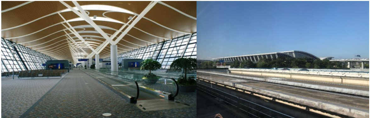
นำท่านเดินทางออกจากสนามบินนานาชาติผู้ต่ง เชียงใหม่ เพื่อไปถ่ายรูปจุดแลนด์มาร์ค คู่กับ

ถึง สนามบินนานาชาติผู้ต่ง เมืองเชียงใหม่ นำท่าน ผ่านพิธีตรวจคนเข้าเมือง