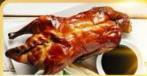
เป็ด Four Season