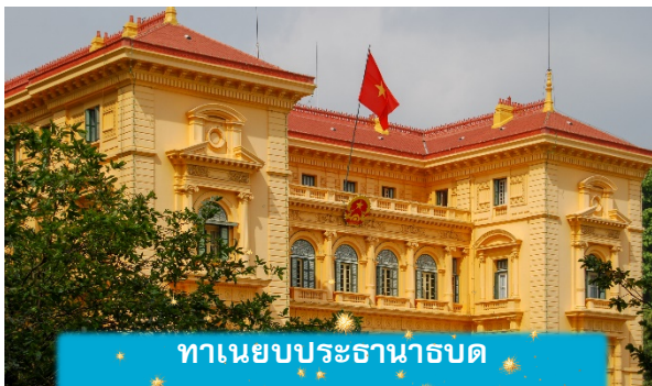
ทำเนียบประธานาธิบดี

เช้า บริการอาหารเช้า ณ ห้องอาหารของโรงแรม นำท่านถ่ายรูปด้านนอก สุสานโฮจิมินห์ จุดเริ่มต้นของการเข้าใจเวียดนาม สถานที่อันเงียบสงบที่สะท้อนจิตวิญญาณของผู้นำผู้ยิ่งใหญ่ สุสานแห่งนี้ไม่ได้เป็นเพียงอนุสรณ์ แต่คือบทเรียนประวัติศาสตร์ที่สัมผัสได้จริง นำท่านเดินทางสู่จุดศูนย์กลางแห่งประวัติศาสตร์เวียดนาม นำชมด้านนอก ทำเนียบประธานาธิบดี อาคารสีเหลืองอร่ามในสไตล์ฝรั่งเศส ที่ยังคงใช้ในพิธีการสำคัญของชาติและชม บ้านพักลุงโฮ บ้านไม้เรียบง่ายริมสระบัว ที่เผยให้เห็นชีวิตสมถะของผู้นำผู้ยิ่งใหญ่ "โฮจิมินห์" สองสถานที่ สองเรื่องราวที่สะท้อนความเป็นเวียดนามอย่างลึกซึ้ง ไม่ใช่แค่ท่องเที่ยว แต่คือการเข้าใจจิตวิญญาณของประเทศนี้อย่างแท้จริง เที่ยง บริการอาหารกลางวัน ณ ภัตตาคาร