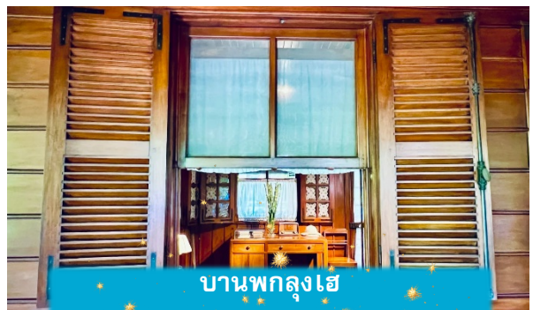
บ้านพักลุงโฮ