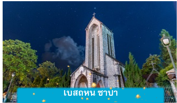
เบสถหิน ซาปา