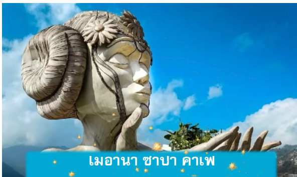
เมอานา ซาปา คาเฟ่

เย็น บริการอาหารค่ำ ณ ภัตตาคาร พิเศษ ... เมนูหม้อไฟแซลมอน + ไวน์แดง ที่พัก SAPA CHARM HOTEL ระดับ 4 ดาวมาตรฐานท้องถิ่น หรือเทียบเท่า