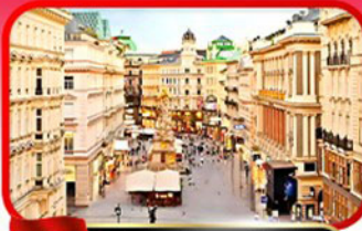
ย่านคาร์ทเนอร์สตรีก