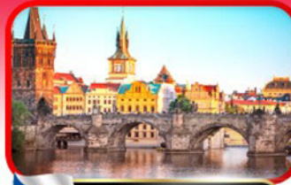
เขื่อนสะพานชาร์ลส์