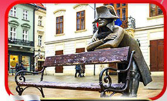
ย่านเมืองเก่าปราทิสลาวา

เที่ยวเมืองสวยริมทะเลสาบ ฮัลล์สตัดท์ • ชมเมืองไข่มุกแห่งโบฮีเมีย เซสกี คุรมลอฟ • ปრაก • เวียดนาม • ซอปปิงพาร์นดอร์ฟ เอาก์เล็ท