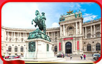
พระราชวังฮอเฟนเบิร์ก