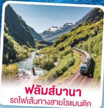
พหลิมส์บานา รถไฟฟ้าสายโรเมนติก