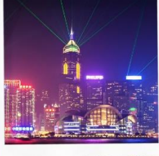
SYMPHONY OF LIGHT