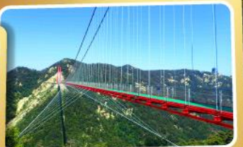
สะพานแวนอ้ายจ้าย