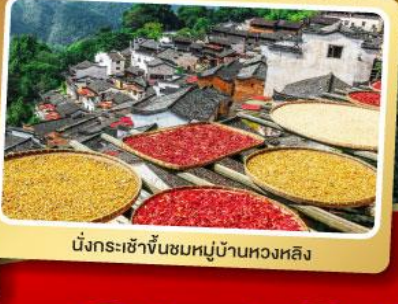
นั่งกระเช้าขึ้นชมหมู่บ้านหวงหลิง