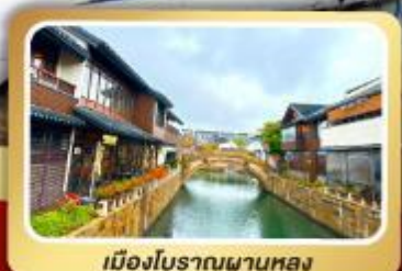
เมืองโบราณผานหลง