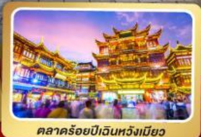
ตลาดร้อยปีเวินหวงเมี่ยว