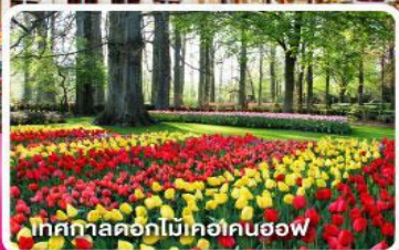
เทศกาลดอกไม้ที่เคอนฮอฟ