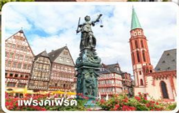
แฟรงค์เฟิร์ต