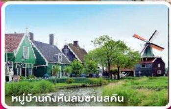
หมู่บ้านกังหันลมชาวนสคัน