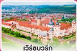
เวิร์ชบวร์ค