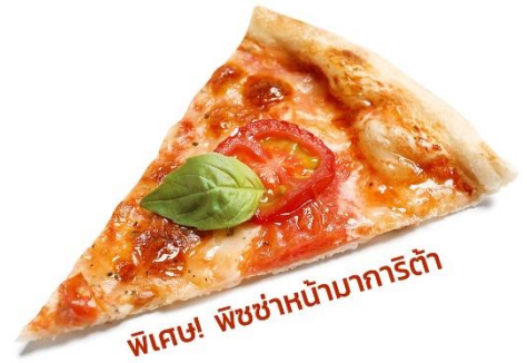
พิเศษ! พิซซ่าหน้ามาการิตต้า

เที่ยง ๑๐ รับประทานอาหารเที่ยง (มื้อที่1) จากนั้นนำท่านเดินทางสู่ เมืองปิซ่า (Pisa) (ระยะทาง 355 ก.ม. / 6 ชม.) เป็นเมืองที่เป็นที่รู้จักอย่างดีเกี่ยวกับ หอเอนเมืองปิซาซากโบราณวัตถุของเมืองที่ยังหลงเหลือจากศตวรรษที่5ก่อนคริสตกาล เป็นเมืองที่เคยมีความสำคัญมากด้านการค้าขายในแถบทะเลเมดิเตอร์เรเนียน