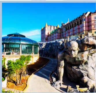
หมู่บ้านฝรั่งเศส