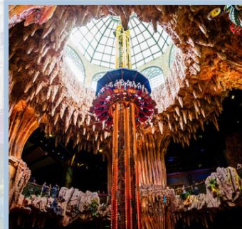
สวนสนุก Fantasy Park

ห้ามพลาด !! สัมผัสประสบการณ์ใหม่ไปกับ รถรางอัลไพน์โคสเตอร์ (ALPINE COASTER) นั่งรถรางชมธรรมชาติ เครื่องเล่นที่เป็นที่นิยมของประเทศเวียดนาม รถรางเล็กบังคับด้วยมือ สามารถควบคุมให้ช้าหรือเร็วได้ ปลอดภัย สามารถนั่งได้ 2 คน เชิญท่านสนุกสนานกับรถรางและชมธรรมชาติของเขาบานาฮิลล์