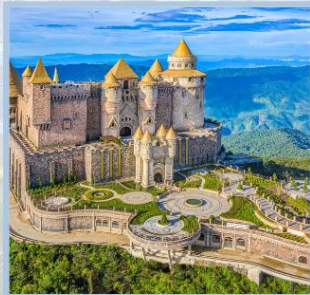
ปราสาทจันทรา