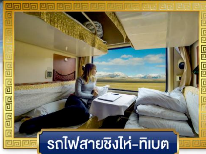
รถไฟสายชิงไห่-ทิเบต