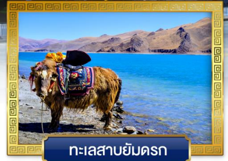
ทะเลสาบยัมดรก

เดินทางโดย: สายการบินลัคกี้แอร์ & ไซน่าอีสเทิร์นแอร์ไลน์