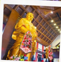
วัดเชกงกมิว