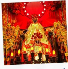
เจ้าแม่กวนอิมฮองฮ่า