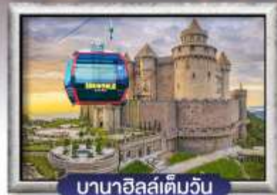
บาน่าฮิลล์เต็มวัน

เดินทางโดยสายการบินเวียตเจ็ทแอร์ 🍴 อาหาร : 5 มื้อ