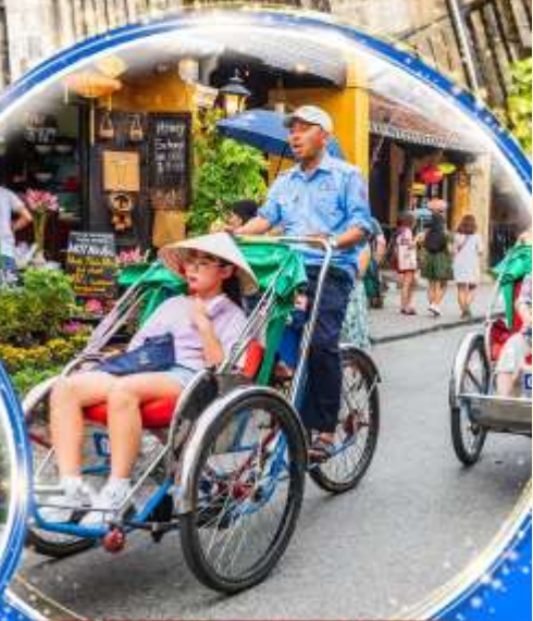
นั่งรถสามล้อซิโคล

พักผ่อน บานาฮิลล์ 1 คืน นั่งกระเช้าที่ยาวที่สุดในโลก ขึ้นสู่บานาฮิลล์ ชมเมือง ฮอยอัน เมืองมรดกโลกที่สวยงามและเจียบสงบ พิเศษ!! บุฟเฟต์นานาชาติ บานาฮิลล์