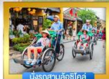
นั่งรถสามล้อซีโคส