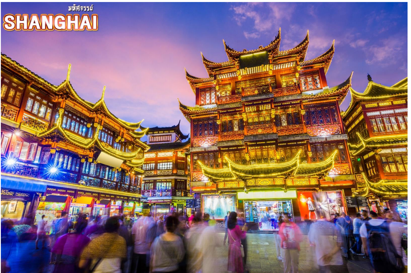
จากนั้น ชมบรรยากาศของ ตลาดร้อยปีเงินห้วงเมี่ยว ตลาดที่เก่าแก่ของเมืองเซี่ยงไฮ้ อาคารบ้านเรือน บริเวณนี้ มีสไตล์สถาปัตยกรรมแบบจีนโบราณที่ยังคงความงดงามเอาไว้ ทั้งร้านขายอาหาร ร้าน