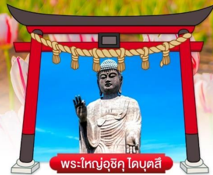
พระใหญ่อุซึคุ ไดบุตสึ