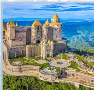
ปราสาทจีนตรา