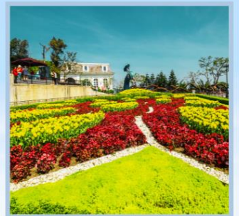
โซงโอบัว