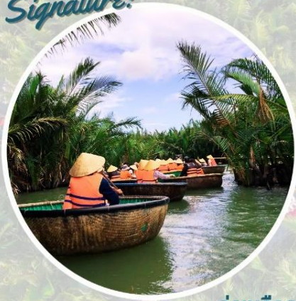
ล่องเรือกระด้ง

หมู่บ้านกัมกาน CAM THANH WATER COCONUT VILLAGE