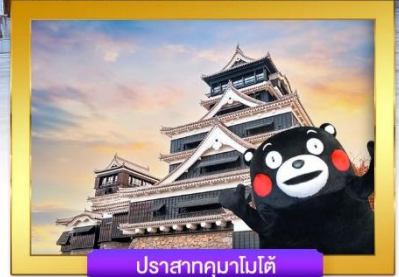
ปราสาทคามาโมโต้