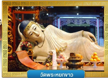
วัดพระหยกขาว