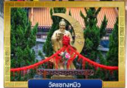
วัดเซ่งห้วย