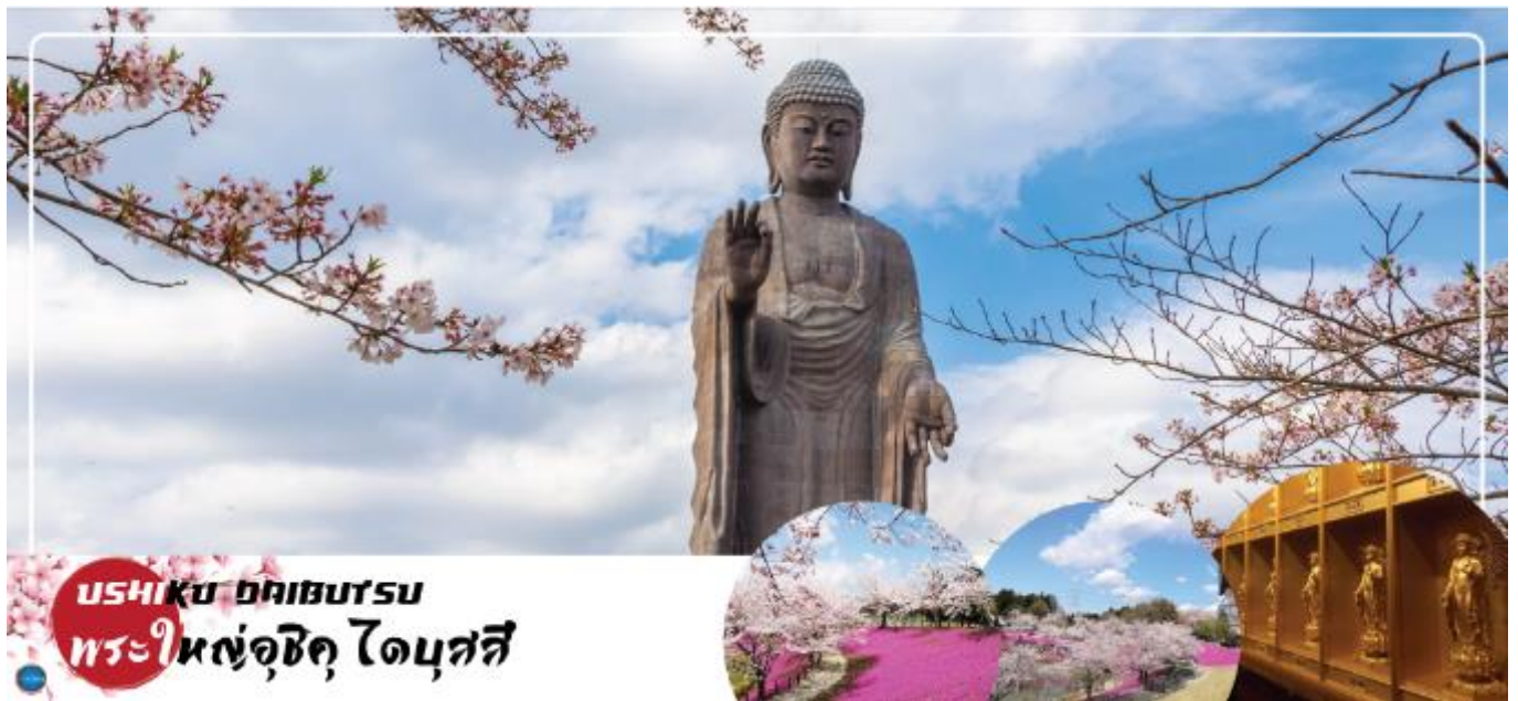
USHIKU DAIBUTSU พระใหญ่อุซึกุ ไดบุตสึ

นำท่านนมัสการ พระใหญ่อุซึกุ ไดบุตสึ (Ushiku Daibutsu) (ใช้เวลาเดินทางประมาณ 50 นาที) เป็นพระพุทธรูปปางยืนที่สูงที่สุดของประเทศญี่ปุ่น และเคยเป็นรูปปั้นที่สูงที่สุดในโลกที่ถูกบันทึกไว้ โดยหนังสือบันทึกสถิติโลกกินเนสบุ๊ค (Guinness Book of world records) เมื่อปี ค.ศ. 1995 ด้วย จากความสูงถึง 120 เมตร ทำให้สามารถมองเห็นได้ตั้งแต่ใจกลางเมืองโตเกียวเลยทีเดียว สามารถเข้าไปยังบริเวณภายในรูปปั้นและขึ้นไปยังจุดที่เป็นหอสังเกตการณ์ในระดับความสูงที่ 85 เมตร ซึ่งจะอยู่ตรงส่วนของหน้าอกพระพุทธรูป เป็นจุดที่สามารถมองเห็น วิวในมุมด้านกว้างได้ ทั้งหมด บนชั้นนี้จะมีกระจกที่เป็นช่องหน้าต่างอยู่ด้วยกัน 4 ด้าน และมองเห็นภูเขาไฟฟูจิได้จากตรงนี้อีกด้วย ( ราคาไม่รวมค่าเข้าพระพุทธรูปด้านใน ) บริเวณใกล้เคียงจะมีสวนขนาดใหญ่เนื่องจากต้นไม้ในสวนส่วนมากเป็นต้นซากุระ ในช่วงที่ซากุระบานที่นี่จึงสวยงามเป็นพิเศษ เรียกได้ว่ามาไหว้พระอย่างเดียวก็อึ้งบุญแล้ว แล้วยังได้อึ้งใจไปกับวิวสวยๆอีกด้วย ( ราคาไม่รวมค่าเข้าชมสวน ) นำท่านเดินทางสู่ เมืองนาริตะ (ใช้เวลาเดินทางประมาณ 40 นาที)