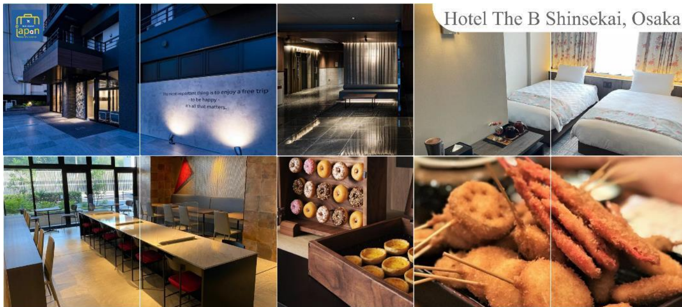
Hotel The B Shinsekai, Osaka

HOTEL THE B SHINSEKAI, OSAKA หรือเทียบเท่าระดับเดียวกัน