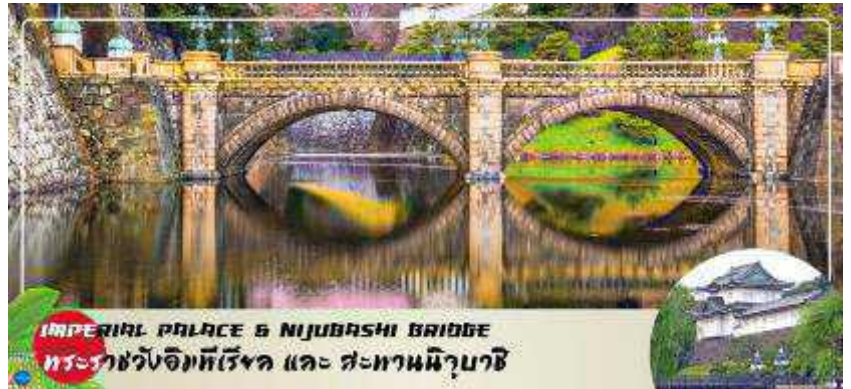
IMPERIAL PALACE & NIJUBASHI BRIDGE พระราชวังอิมพีเรียล และ สะพานนิจูบาชิ

เส้นของสะพานข้ามคูน้ำสู่พระราชวังแห่งกรุงโตเกียว ที่มีชื่อเรียกว่าแว่นตาก็เพราะส่วนโค้งที่อยู่ติดกันด้านล่างสะพานนั้นมีรูปร่างเหมือนแว่นตาเมื่อสะท้อนกับผิวน้ำ ส่วนทางด้านหน้าพระราชวังเป็นอุทยานแห่งชาติโคเคียวไกเอ็น (Kokyo Gaien National Garden) เป็นสวนสาธารณะขนาดใหญ่