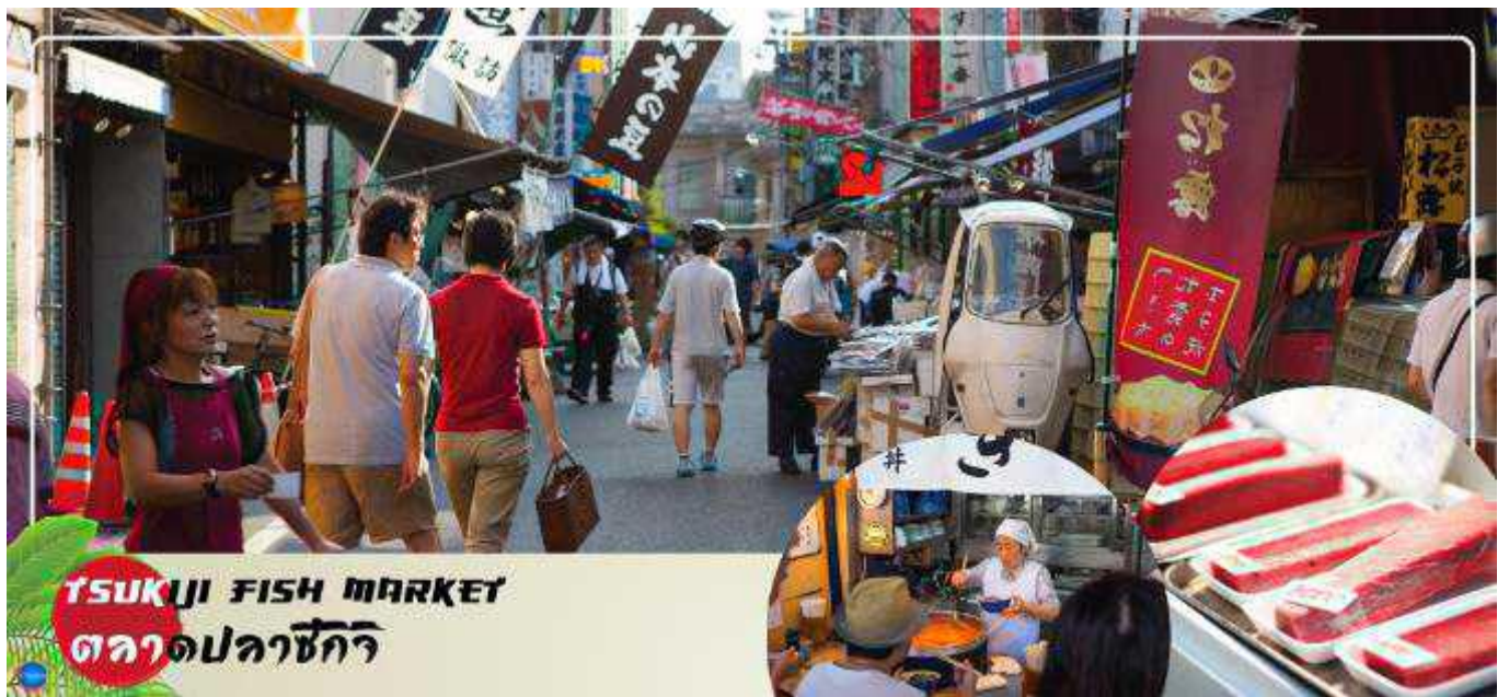
TSUKIJI FISH MARKET ตลาดปลาชิจิกิ

นำท่านสู่ (ใช้เวลาเดินทางประมาณ 20 นาที) ตลาดสดเก่าแก่แห่งหนึ่งของจังหวัดโตเกียว มีของอร่อยมากมายหลากหลายให้ท่านได้เลือกซื้อแวะชิมความอร่อยกันอย่างจุใจ ภายในตลาดปลามีร้านทั้งร้านซูชิ แลปลาสดๆ ทั้งปลาทูน่า ปลาแซลมอน เป็นต้น ความอร่อยที่ไม่ควรพลาดอีกมากมายเช่น ไชหวานย่างชื่อดัง ข้าวหน้าปลาไหล กว๋ยเต๋ยวเนื้อตุ๋นรสเด็ด ฯลฯ รวมถึงผลไม้ที่ท่านสามารถเลือกซื้อกลับบ้านได้อีกด้วย