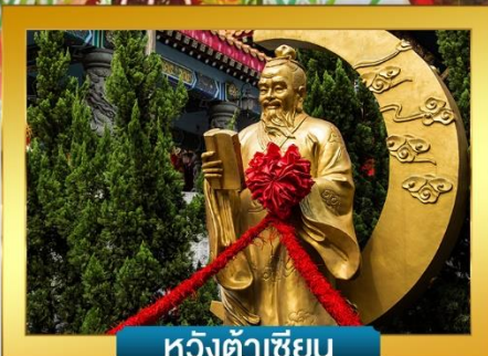
หวังต้าเซียน