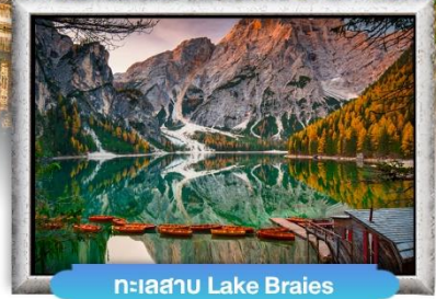
ทะเลสาบ Lake Braies