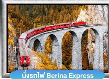
นั้งรถไฟ Berina Express