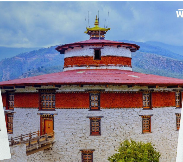
พิพิธภัณฑ์สถานแห่งชาติ