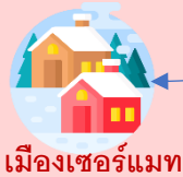
เมืองเซอร์แมท