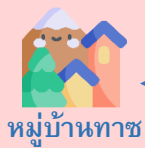
หมู่บ้านทาช

เที่ยง บริการอาหารกลางวัน ณ ภัตตาคารอาหารจีน (7)